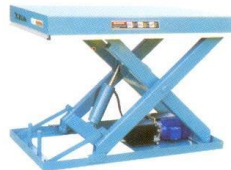
Model: SLT1010, SLT 2010