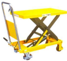
Model: TT150, TT300 TT500, TT1000