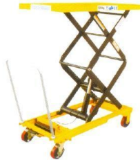
Model: TT350, TT800, TT680